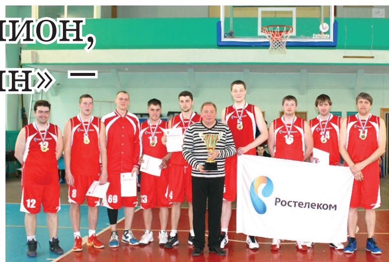
Победитель чемпионата – РОСТЕЛЕКОМ

В группе А играли «Ростелеком», «Водоканал», «Балтика» и «МегаФон», а в группе Б – «Рубин», «Газинформсервис», «Прометей» и «Газпром инвест Запад». В качестве эксперимента командам разрешалось усилиться одним игроком, не работающим в их организации. К примеру, в московской Корпоративной лиге, по Регламенту, разрешено выступать двум таким игрокам за команду. Сенсация произошла в группе А. Не проигравший до этого за два года в чемпионатах ФСО профсоюзов «Россия» ни одного матча «Ростелеком» в дополнительное время уступил кубок «Водоканалу». Интересный факт – за 40 игр регулярного чемпионата и 8 игр Кубка