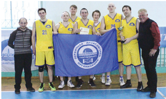
Обладатель Кубка – ВОДОКАНАЛ

это была единственная дополнительная пятиминутка, которая и решила судьбу престижного трофея. В группе Б борьба в финальном матче «Рубина» и «Прометея» прошла менее напряженно. «Рубин» без особых проблем переиграл соперника, и по праву завоевал второй баскетбольный кубок.