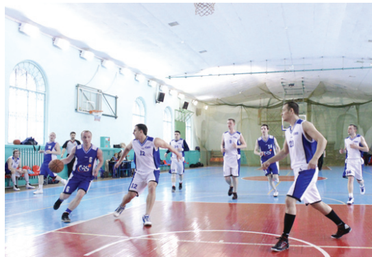
Газинформсервис – Газпром инвест Запад