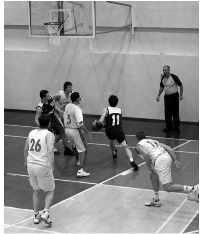
Эпизод матча «Турбостроитель» – «Прометей»