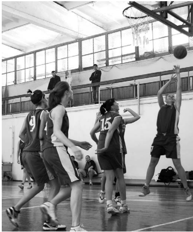
Эпизод матча «Технолинк» – «Кронштадт»

Под стать команде мастеров выступают и воспитанницы СДЮШОР-2 «Аврора». В марте сразу два девичьих коллектива спортшколы стали победительницами первенства России в возрастных группах 1995-1996 и 1997-1998 годов рождения.