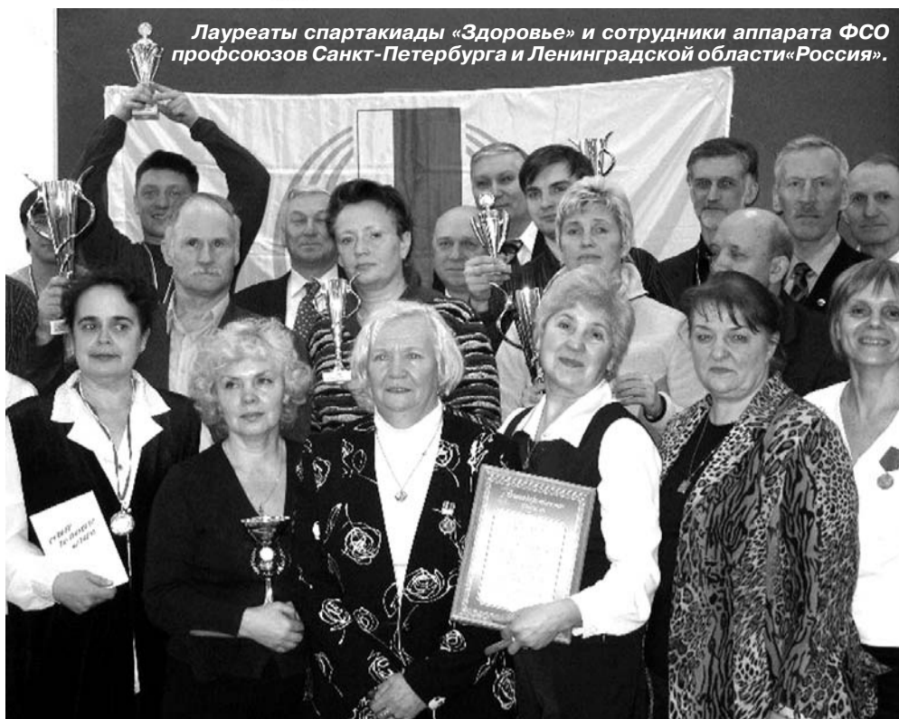
Лауреаты спартакиады «Здоровье» и сотрудники аппарата ФСО профсоюзов Санкт-Петербурга и Ленинградской области «Россия».

Рабочий спорт объединяет все городские и областные предприятия, и забота о здоровье трудящихся входит в нашу сферу интересов.