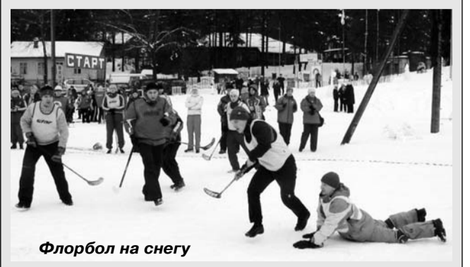
Флорбол на снегу

Соревнования закончились награждением победителей, а весь праздничный день завершился на мажорной ноте концертом настоящих и самодеятельных артистов. Местные жители и отдыхающие с удовольствием примкнули к народному масленичному гулянию. Им тоже понравился такой воскресный отдых, концерт и хороводы на поляне. Им очень хотелось, чтобы такие праздники устраивали чаще.